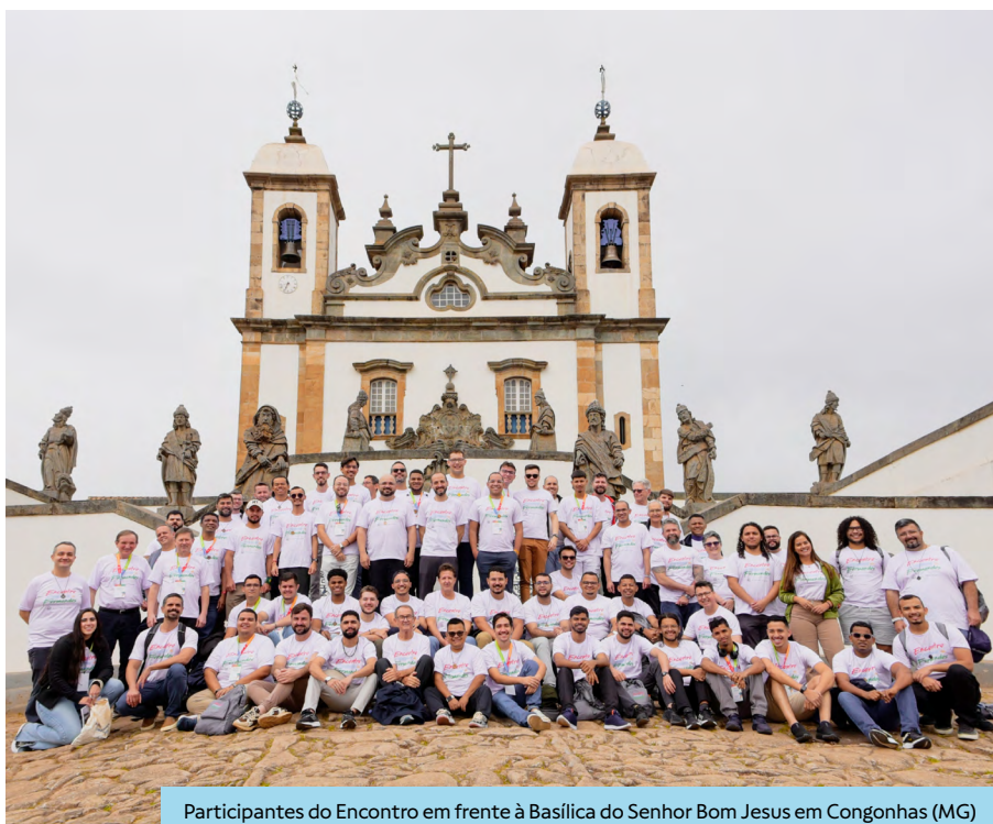
Participantes do Encontro em frente à Basílica do Senhor Bom Jesus em Congonhas (MG)