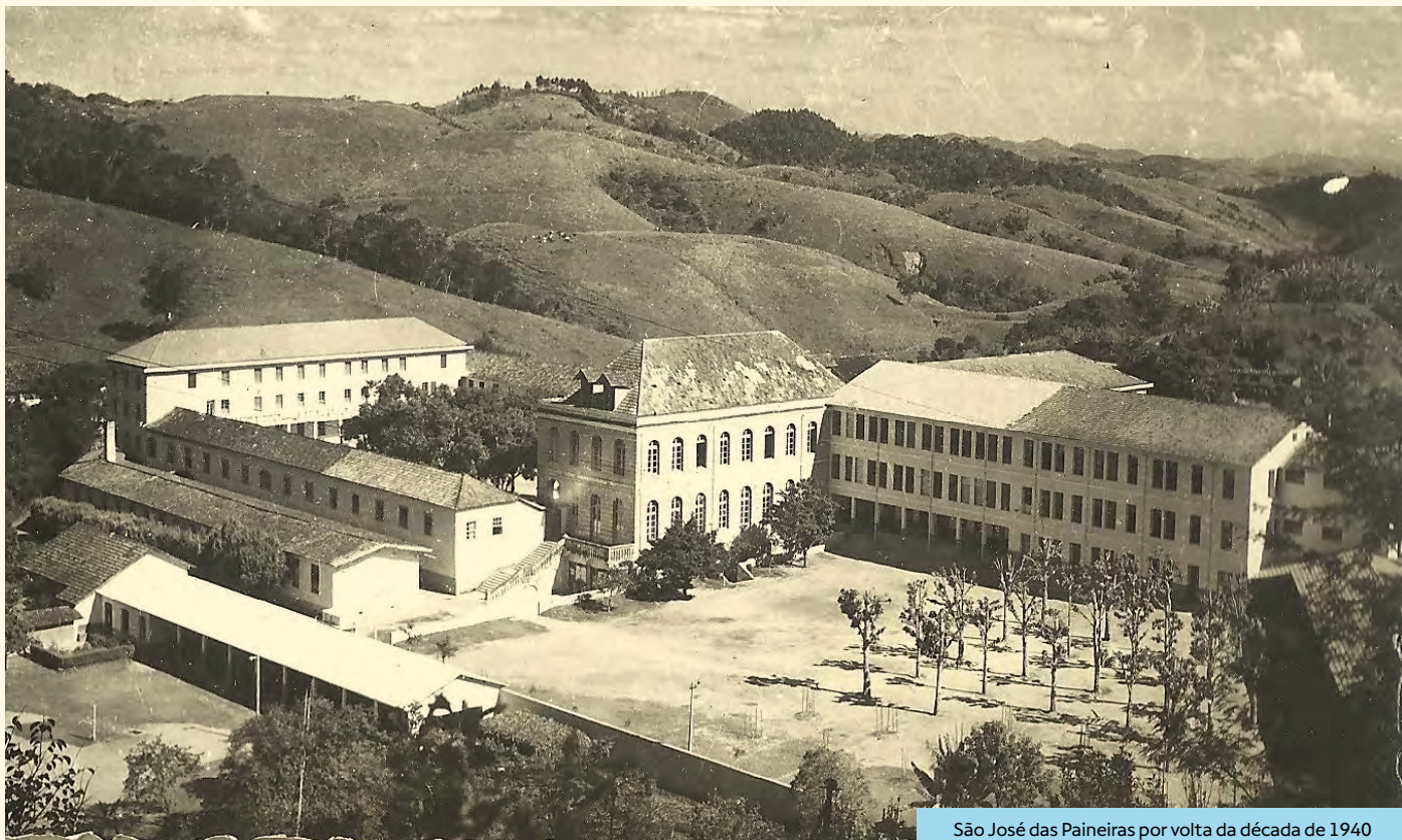
São José das Paineiras por volta da década de 1940