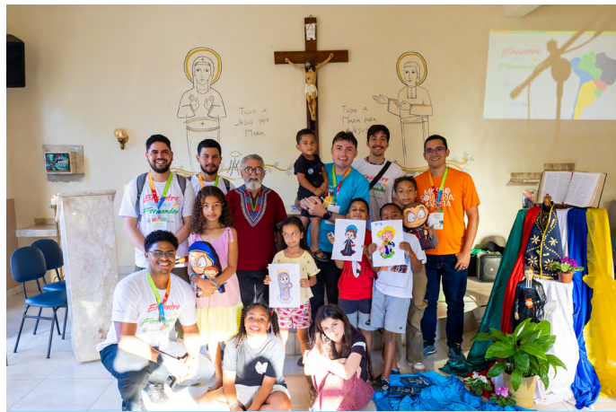
Missão na Comunidade São Marcelino Champagnat - Ribeirão das Neves (MG)

Ao final do Encontro, todos regressaram às suas comunidades, mas carregando na memória e no coração algo que vai além da lembrança de dias vividos juntos: a convicção de que o carisma de Champagnat permanece vivo e continua a inspirar novas gerações a seguir Jesus ao estilo de Maria, com paixão, simplicidade e esperança.