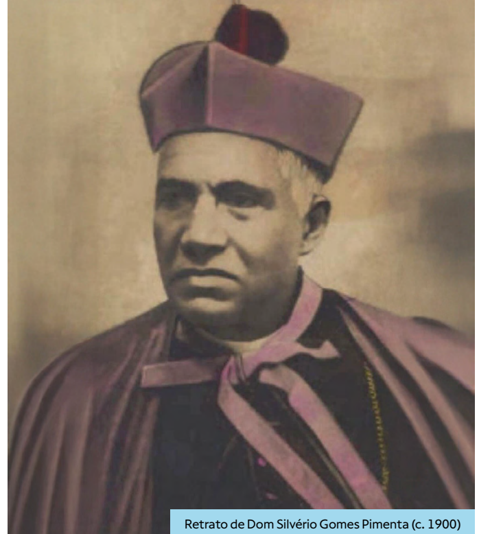
Retrato de Dom Silvério Gomes Pimenta (c. 1900)

Não era apenas a autoridade do bispo que se impunha, mas sua proximidade. Os Irmãos conservaram lembranças de episódios singulares, como as visitas-surpresa que Dom Silvério lhes fazia, chegando de forma inesperada à comunidade, partilhando momentos simples e deixando entrever um coração paternal. Para eles, Dom Silvério era mais que pastor: “um verdadeiro pai espiritual e guardião da missão”.