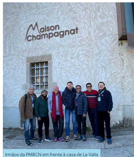
Irmãos da PMBCN em frente à casa de La Valla