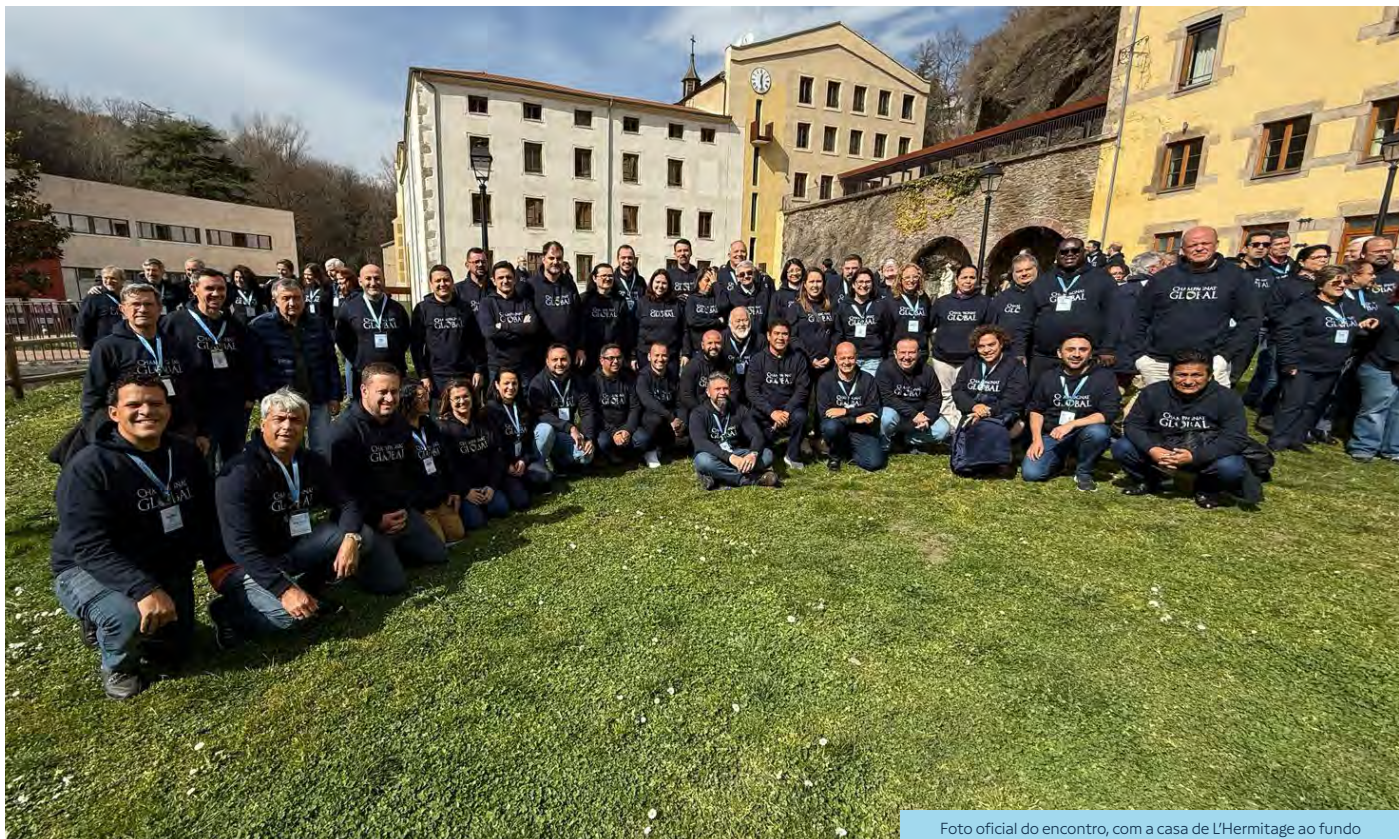
Foto oficial do encontro, com a casa de L'Hermitage ao fundo

A segunda reunião presencial da Champagnat Global, a Rede Global Marista de Escolas , foi realizada na Casa Mãe do Instituto Marista, em L'Hermitage, França, entre 7 e 11 de março. Participaram cerca de 140 pessoas, entre representantes do Governo-Geral, da equipe e do comitê consultivo da Rede, das estruturas e equipes de educação de cada unidade administrativa, especialmente diretores de escolas e representantes das diversas redes de missão do Instituto Marista (universidades, editoras, solidariedade, voluntariado, juventude marista).