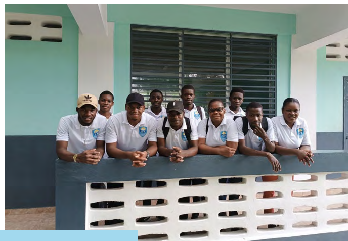
Estudantes das obras maristas do Haiti