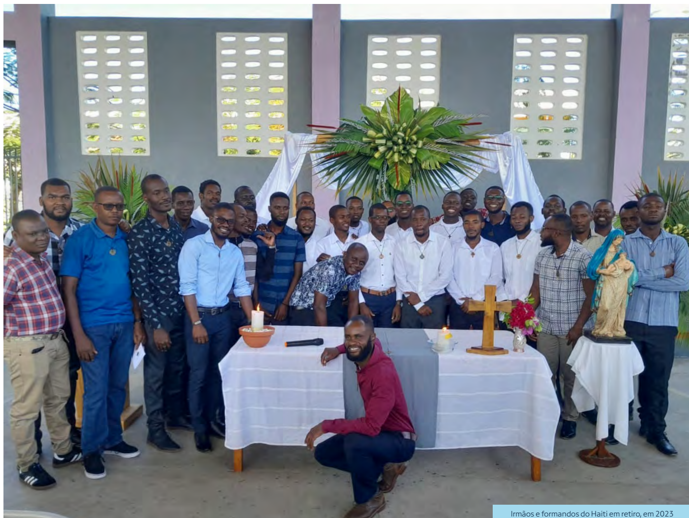
Irmãos e formandos do Haiti em retiro, em 2023

No dia 9 de março, o Instituto Marista celebra uma data especial no continente americano: os 40 anos de presença no Haiti. Em 1985, os primeiros Irmãos, oriundos da então Província do Canadá, começaram a ser presença constante na pequena aldeia costeira Damme Marie. No ano seguinte, fundaram a primeira comunidade na pequena cidade de Latibolière, a 10 km da principal cidade da região, Jérémie. No contexto histórico, a missão marista foi se desenvolvendo no país, sempre conduzida pelos Irmãos canadenses.