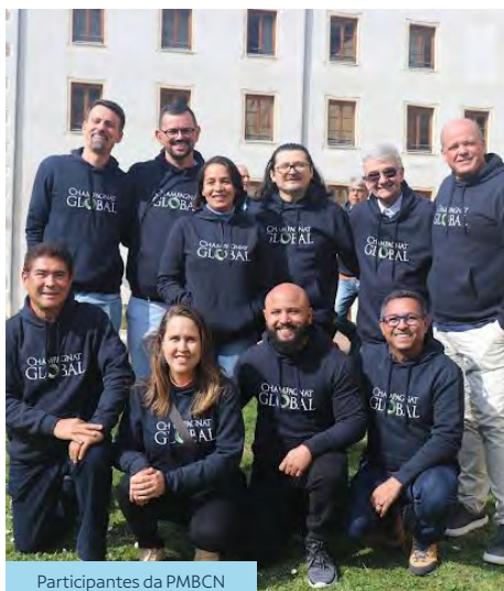
Participantes da PMBCN