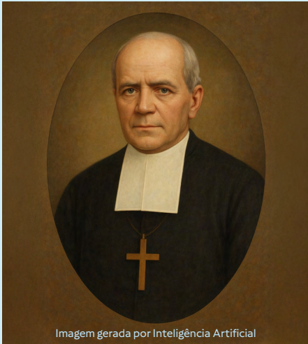
Imagem gerada por Inteligência Artificial