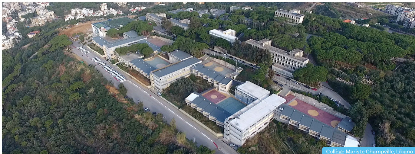
Collège Mariste Champville, Líbano