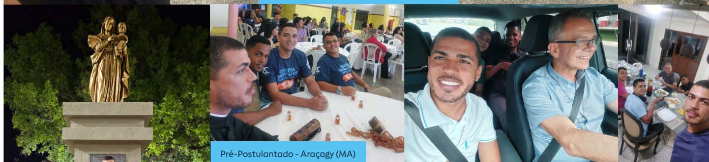
Pré-Postulantado - Araçagy (MA)