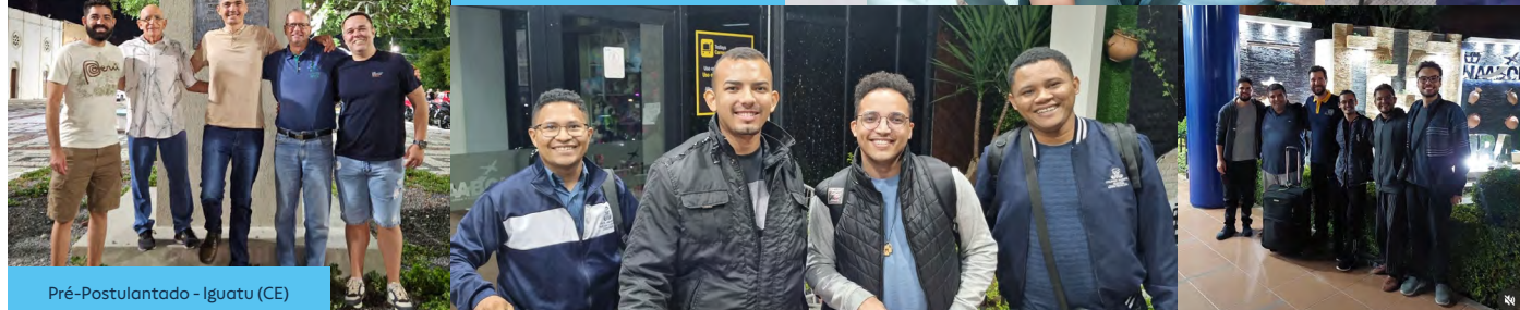
Pré-Postulantado - Iguatu (CE)