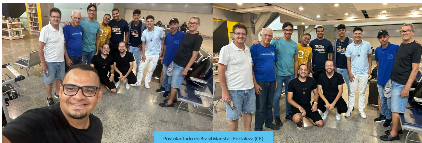
Postulantado do Brasil Marista - Fortaleza (CE)