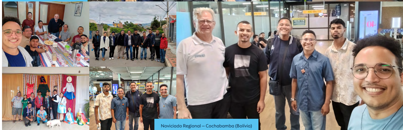
Noviciado Regional – Cochabamba (Bolívia)