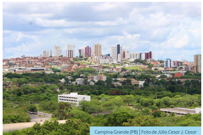
Campina Grande (PB)

A PMBCN já se encontra no território da Diocese de Campina Grande há muitas décadas, desde 1953, por meio das casas de formação que existiram em Lagoa Seca (PB), unidade social, projetos e espaço de eventos, todos na mesma cidade.